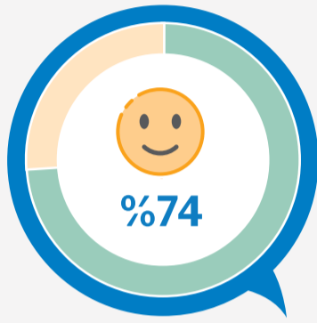
مطار الملك خالد الدولي تقييم 243,277

نظافة مرافق المطار 78% إجمالي التقييمات : 100,734