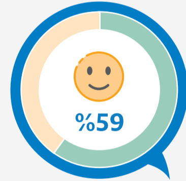
مطار الملك عبدالعزيز الدولي تقييم 176,024