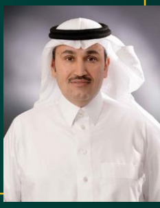
معالي المهندس صالح بن ناصر الجاسر وزير النقل والخدمات اللوجستية رئيس مجلس إدارة الهيئة العامة للطيران المدني