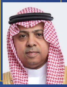
معالي الأستاذ عبدالعزيز بن عبدالله الدعيج